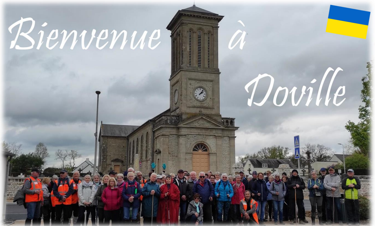
Rendez-vous parking devant église et la salle communale