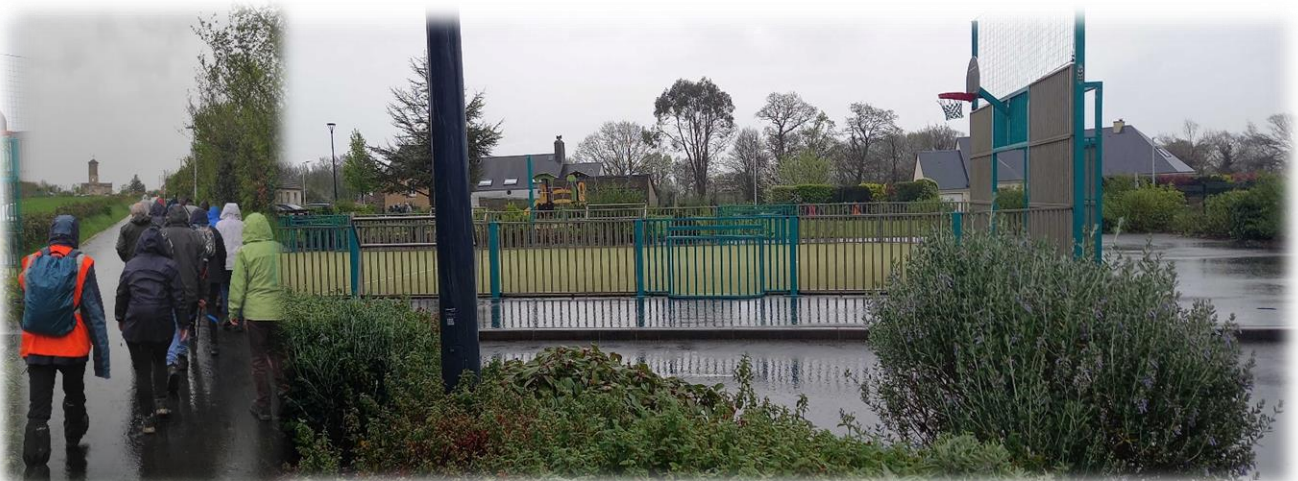
Fin de la randonnée sous la pluie