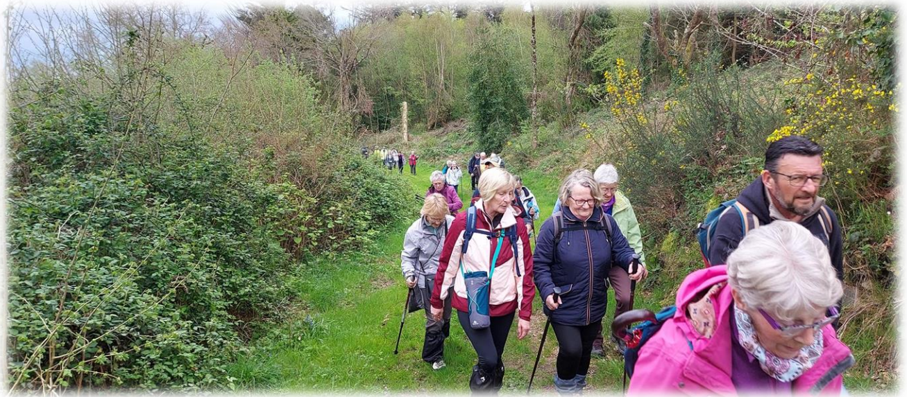
Tandis que le long parcours prend la direction du Mont