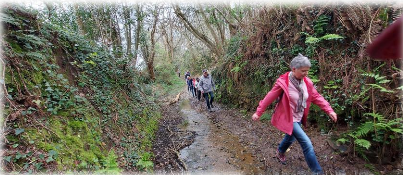
Au pied du Mont, le chemin est un peu humide