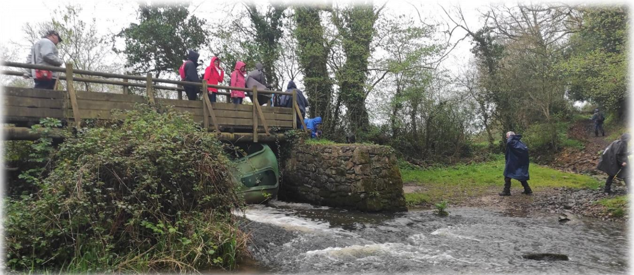
Au lieu-dit la Cuiroterie, autre passage du ruisseau Le Buisson, cette fois-ci sur une passerelle, sous laquelle un truc curieux !