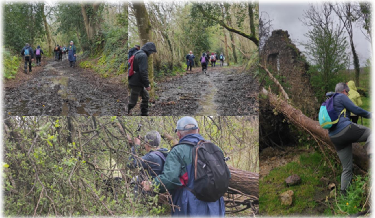
Passage humide et quelques embûches, un peu de gymnastique ça fait du bien !