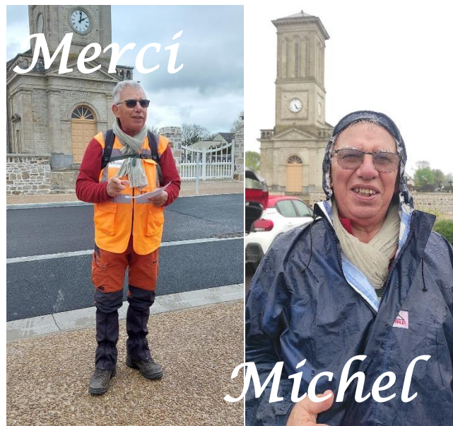
Au départ - A l'arrivée