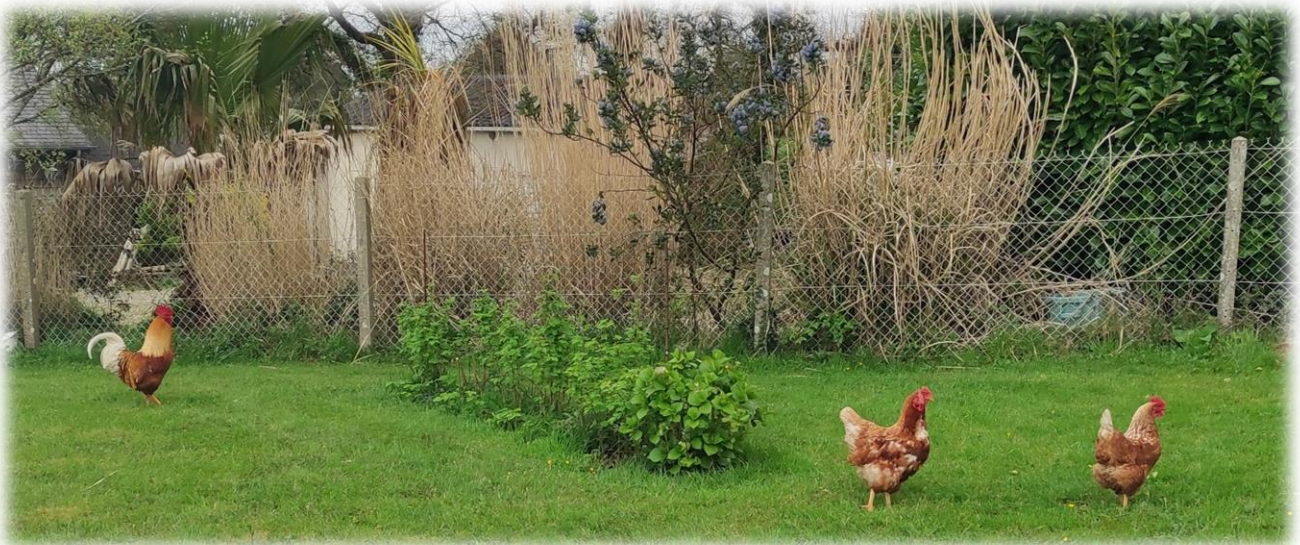
Hameau le Boscq, le coq en chantant

A notre gauche, les contreforts du mont de Doville, et à notre droite le marais de la Sangsurière, vaste territoire de 231 ha. L'origine du nom Sangsurière : sangsue bien sûr, petites bêtes qui vous collent à la peau pour sucer votre sang, encore nombreuses l'été, paraît-il !